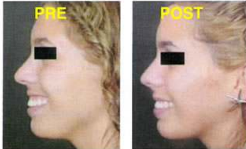
Bioplastia de mentón.

Es un nuevo conjunto de procedimientos que permiten ofrecer a nuestros pacientes rejuvenecer sin incisiones quirúrgicas o procedimientos traumáticos así como corregir los defectos faciales y del contorno corporal en forma rápida y práctica.