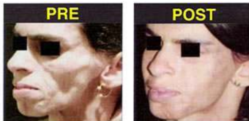
Bioplastia de secuela de parálisis facial.

ESCRÍBANOS: clinarroyo@hotmail.com www.clinicasarroyo.com